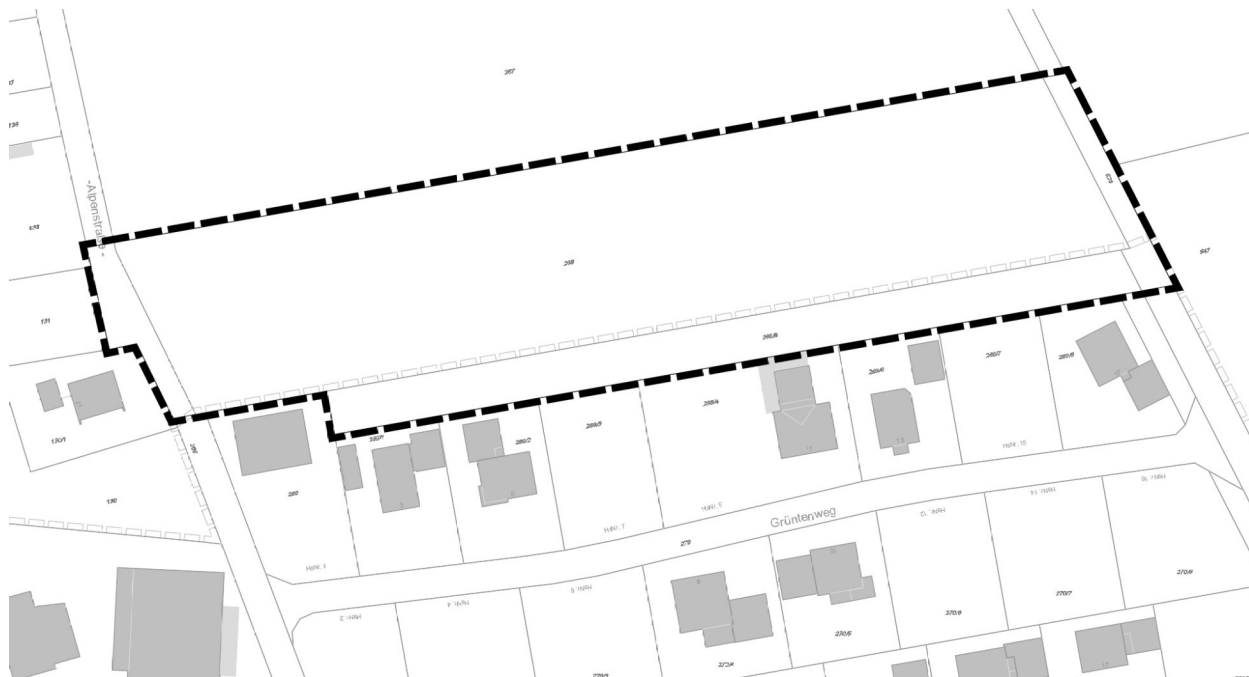
Abbildung 1: Lage des Geltungsbereichs, unmaßstäblich

Die Abgrenzungen sind auch dem nachfolgenden Lageplan (Abbildung 1) zu entnehmen.